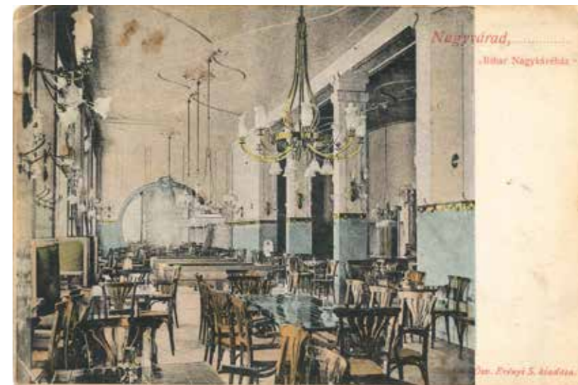
Archív képeslap az egykori Bihar Kávéházzal, 1911 (Mt)