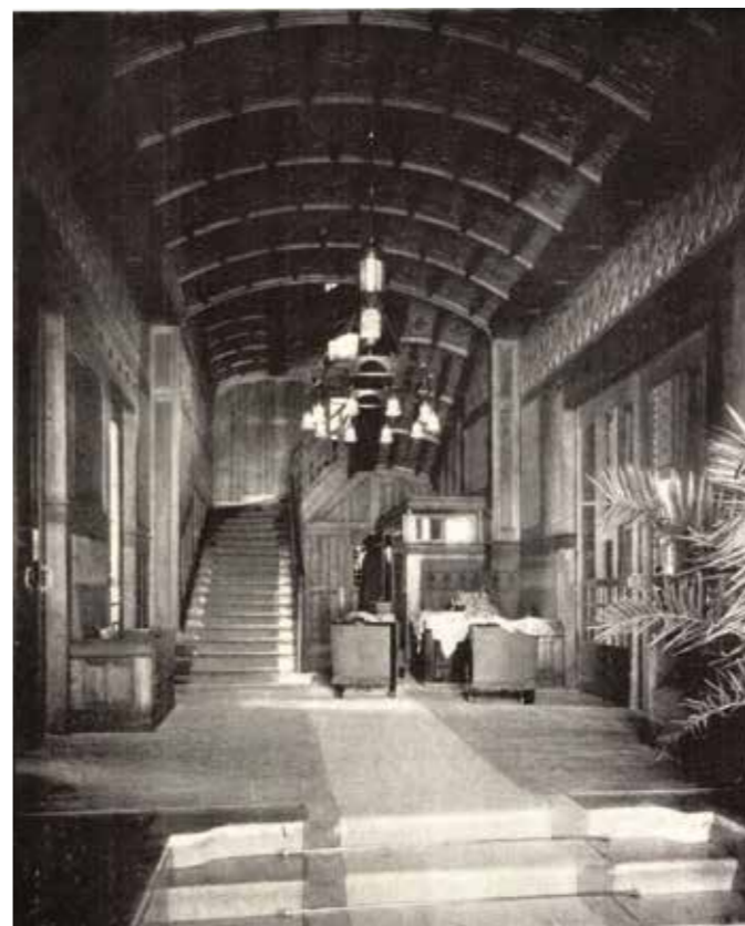
Balra a Lederer-palota hallja, jobbra a női öltözőszoba (M, 1908. 2. sz.)

Kezdték a hall-lal. Barnára pácolt borovefával burkolták, a burkolatot kirakták palisander-betétekkel. A burkolat fölött a falakat kékeszöld szövetvel fődtek, föl a mennyezet koszorújáig. A mennyezet kaszettáit festett gipszornamensekkel töltötték ki. Ebben a keskeny, kis hallban a terület valósággal szélhámoskodik. Nagy csarnoknak mutatkozik: impozáns magasság, jókora szélesség s a nagy-nagy hosszúság látszatával csal. Hátsó részében a hátfalnak nekiinduló falépcsője a tekintetet a méretet dolgában megzavarja. Szinte a messzeségbe látszik vinni, pedig a kezünk ügyében marad. A csarnokból széles toloajtó visz jobbra az ebédlőbe. Sötétbarnás tölgyburkolatát bronzveretek tarkítják. A burkolat faliszekrényeket főd; a nagy ebédlő nagy ebédeinek készlete van bennük. A mennyezet mezőinek ornamensei közt világító testek. És nemes művű bronzcsillárok és fali karok is világosságba