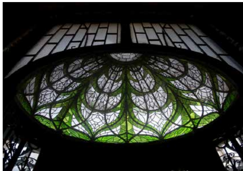
Fent a zöld növényekkel díszített, remekbe szabott üvegkupola a Lederer-palotából – Róth Miksa alkotása (IM A), lent díszes pincerács

Ahogy könyvünkben már említettük, ugyancsak Kernstok Károly készítette a Hét vezért ábrázoló üveglablakok kartonjait a Bálint és Jámbor építészpáros emblematisz épületeként számon tartott debreceni vármegyeháza díszterme számára.