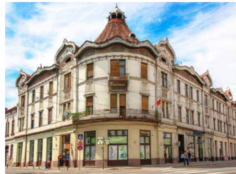
A Füchsl-palota a felújítás előtt (Bálint Imre felvétele, 2018)

A földszinti részt az elegáns Bihar Kávéház – amelynek igényes, szecessziós berendezéséről sajnos, már csak egy korabeli képeslap árulkodik –, illetve egy sörcsarnok foglalta el. A következő korabeli hirdetés felér egy pillanatfelvétellel: „jóforgalmú helyen, kétemeletes, modern bérházban a fényes berendezésű és felszerelésű Bihar Kávéház számára február hó elsejével,