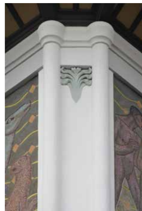
Balra fent részlet a csodaszarvasmondát ábrázoló frízről, lent a fríz sarokkialakítása. Jobbra a Róth Miksa által a Lederer-palotába tervezett és kivitelezett, „a századelő remekei közé tartozó” szélfogó rajza