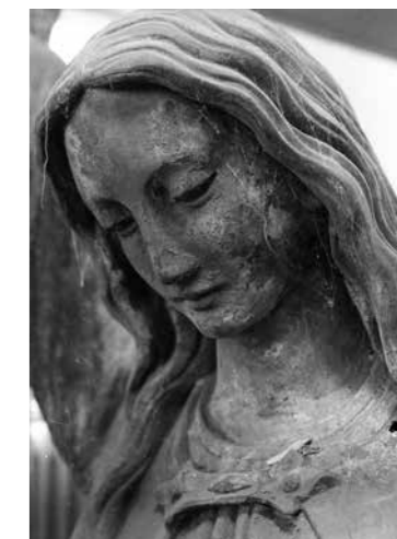
Az eredeti, cinkből öntött és festett Immaculata-szobor torzója 1990-ben a Budapest Galéria sülysápi telepén és napjainkban

Szintén Johann Halbighoz kapcsolódik a már említett Széchenyi-büszk, mellyel ugyancsak voltak gondok. A legnagyobb magyar 1860. április 8-i halálát követően ugyanis Pest kevesebb mint egy hónap leforgása alatt szerződést kötött Halbiggal (akivel akkor már a József nádor szobor miatt amúgy is szerződésben állt), és azért nem érdekelhette a Hans Gasser által két évvel korábban mintázott utolsó hiteles portré mely már akkor rendkívül népszerű volt mert az nem a mindenki által ismert, élete teljében lévő nagy államférfit ábrázolta. Ráadásul a Pesti Városháza tanácstermébe megrendelt mű már csak azért sem lehetett Gasseré, mert az akkor a várossal – és a polgármesterrel – igen szoros kapcsolatot ápoló Halbig még le is szolta munkáját, hogy az a mellszobor nem is hasonlít Széchenyire. Amikor a Gasser műhelyét is megjárt Izsó – aki mestere Széchenyi-portróját két ízben is márványba faragta – tudomást szerzett Pest megbízásáról, úgy vélekedett, hogy mindez „nagyon szép, de ezt Gasser inkább érdemelte volna”. A hasonlatosságra vonatkozó fenti észrevételt egyébként személyesen is megkapta Izsó, amikor müncheni tartózkodása során 1860 nyarán meglátogatta az éppen a büszkön dolgozó szobrászt: „azt mondta, hogy az [a Gasser-féle Széchenyi-