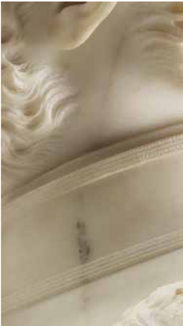
A sok galibát okozó „hamuszürke erecske” Halbig Széchenyi-mellszobrának nyakrészén (SZM-MNG)

Hentzi emlékművét 1899 áprilisában szerelték szét (alapozásának maradványait a Szent György téren 1994–1995-ben zajló ásátások során tárták fel), a szoborcsoport ünnepélyes újraavatására pedig 1899. augusztus 12-én került sor. Az időpontválasztás borzolta a magyar közvéleményt, hiszen másnap a világosi fegyverletétel 50. évfordulója volt. Ugyancsak sérelmezték, hogy az uralkodót József főherceg, a Magyar Honvédség főparancsnoka képviselte. Kritikával illették továbbá azt is, hogy Budapest helyőrsége az osztrák császári himnusz hangjaira vonult el a szobor előtt. A „Götterhalte” ugyan