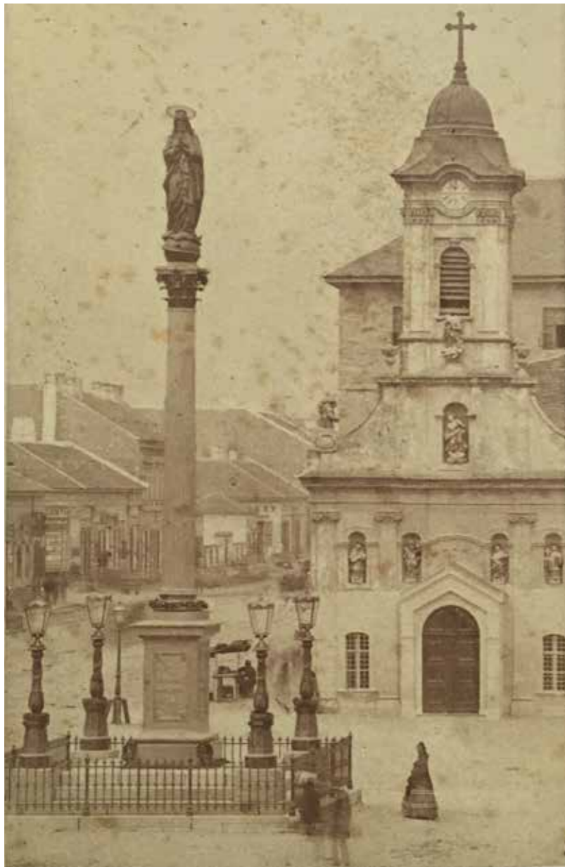
A Johann Halbig-féle Immaculata-oszlop pár évvel 1867-es felavatása után. Háttérben a Rókus-kápolna és Kerepesi (ma Rákóczi) út (Liczkó János felvétele, 1870 körül, BTM Kiscelli Múzeum F.)

gondolkodni, hogy mennyire jól mutatna a lebontott emlékmű talapzatán egy többkarú légszesz kandeláber (miközben a szobor körül már több lámpa is állt ekkoriban). Meglehetősen sok fantázia kellene ahhoz, hogy barátságos lépésnek gondoljuk ezt, s így vélekedhetett Simor is, aki kijelentette, hogy mivel a szobor lábazata nem kandelábertartó, üdvözlőné, ha a