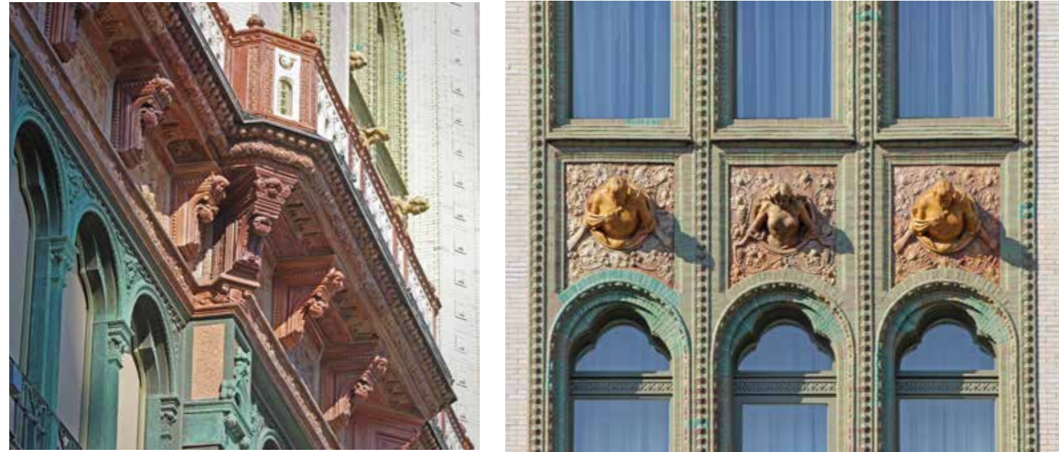
A homlokzat részletei (a szerző felvételei), jobbra a kisebb belső udvar képe, 1914 (ÉpIp, FSZEK); szemben fent és jobbra a passzázs öntöttvas elemes belső homlokzai, balra lent a lefedett kisebb udvar (a szerző felvételei)

egyreszeire kaptak ideiglenes használhatósági hozzájárulást a hatóságoktól. 573