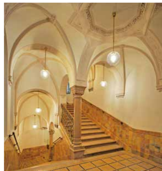
Balra és jobbra a közös pihenős kétkarú lépcső, a felvonó hatszögű építményével

túlórázta, és számos pluszki költséget is magára vállalt, amit addig nem térítettek meg neki. Megbízásának visszavonása ellen érvelt, mondván, egy teljesen új, a körülményeket nem ismerő építész egészen biztosan lassítaná a folyamatot. Ellenkező esetben valamennyi többletköltsége azonnali megtérítését kérte, melynek összegét a 140 000 koronás eredeti honoráriumon felül, további 121 000 koronára tette. Schmahl azt is megemlítette, méltatlannak találta, hogy gyógykezelése idején a pénz-