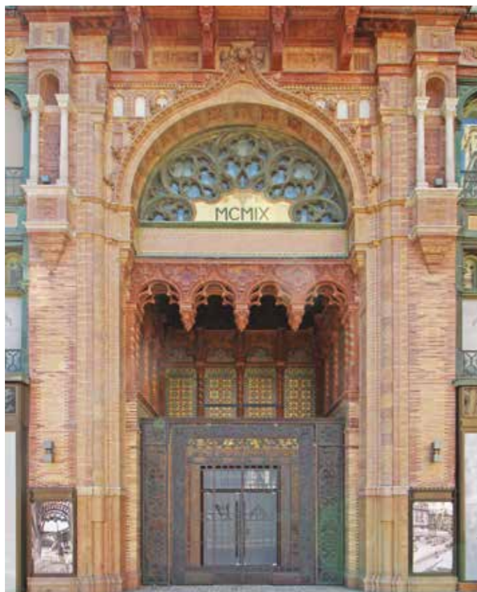
Fent a pénzintézeti fiók egykori bejárata, jobbra a homlokzat részletei, szemben a főpárkány részlete

amelynek valóságosságát ma nem lehet ellenőrizni, de a később kialakult helyzetet jól előrevetíti.