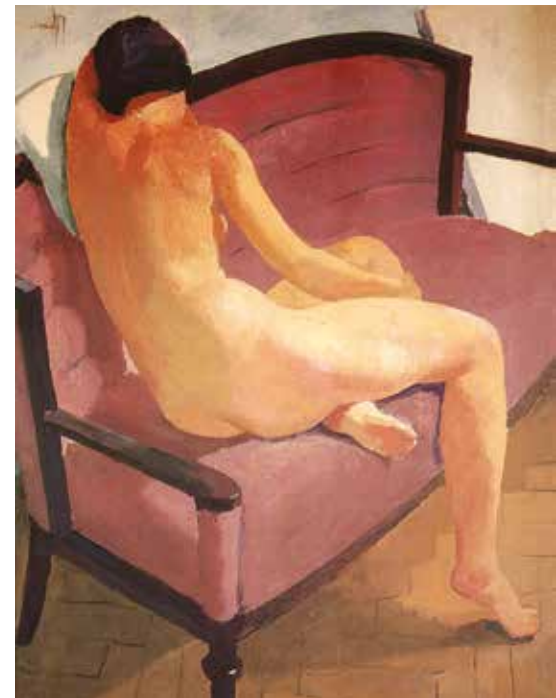
PATKÓ KÁROLY MODELL MŰTEREMBEN, HÁTTÉRBE FALNAK TÁMASZTOTT VÁSZNAKKAL

A szobabelső szerkezete Vincent van Goghot, a színek és a formakezelés, a fekvő figura testtartása Henri Matisse-t idézi. A kompozíció éles határokat húz a kép elemei közé, s a színfoltok is erőteljes tagolást, ritmust adnak. A macska pedig nem csak erotikus szimbólum, de fekete foltja a nőalakok hájára is rímel, s a testszínű felület megtörésében is szerepet kap. (1930 k.)