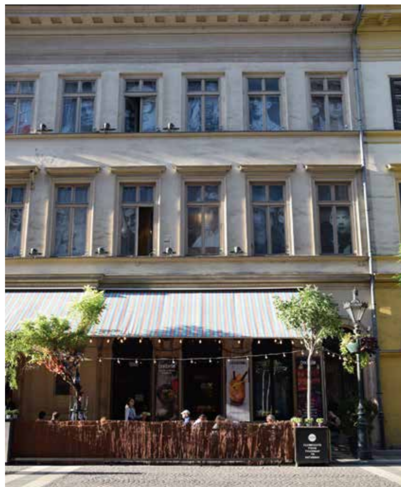
Lent: az V., Arany János utca 7. szám alatt álló lakóház homlokzata (a szerző felvételei, 2017)