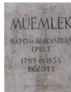
Az egykori paplak és iskola emléktáblája