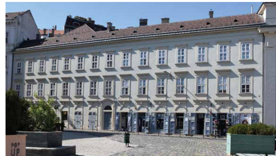
Jobbra: Az épületegyüttes Bárczy István utca felé néző homlokzata (2017)