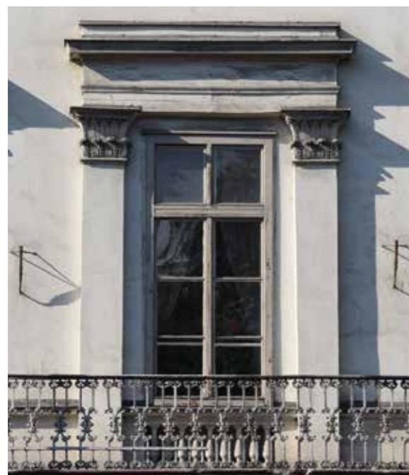
Balra a Derra-ház főhomlokzatának részlete, jobbra Karczag Benjámín kétemeletes háza a mai V., Zrínyi utca 4. szám alatt