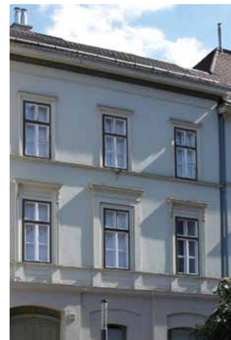
Jobbra a mai Evangélikus Országos Múzeum épületének részlete, a templomhoz csatlakozó egykori paplak és iskola, amely 1795 és 1854 között, három periódusban épült ugyancsak Krausz János, Pollack Mihály és Hild József tervei szerint