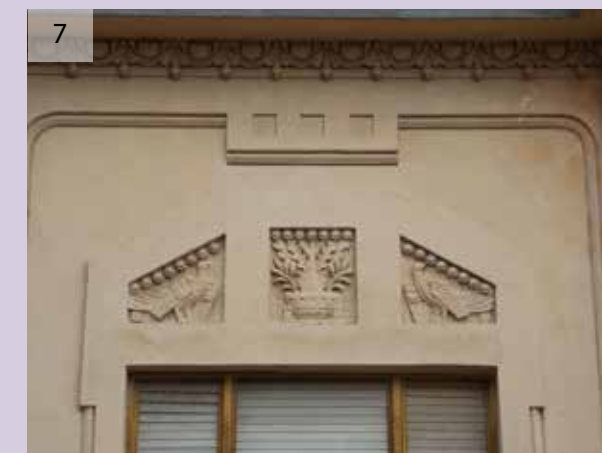
37. sz. ház; ugyanaz a leveles stukkó látható a Tor- más utca 5. és az Ady Endre út 1. számú házon; s még számos ilyen rímre lelhet a városba látogató.